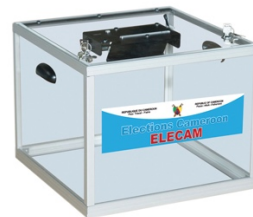
Elections Législatives et Municipales